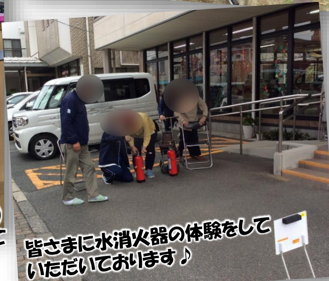
皆さまに水消火器の体験をしていただいております♪