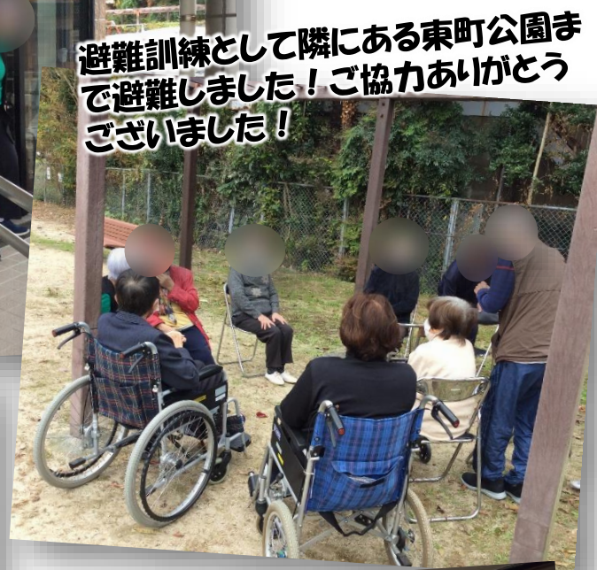
避難訓練として隣にある東町公園まで避難しました!ご協力ありがとうございました!