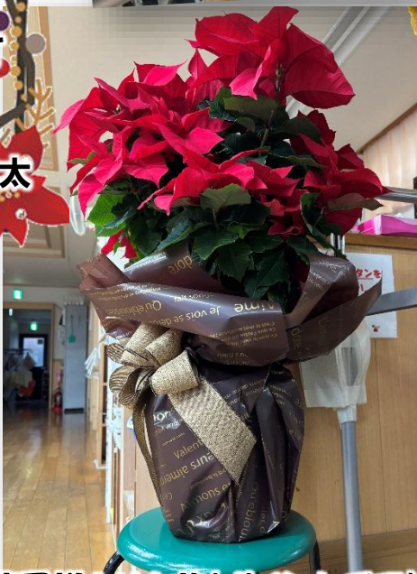
わたや薬局様よりお花(ポインセチア)を頂きました♪通所入口付近に飾っております♪